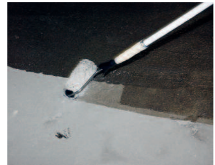
PCI Epoxigrund 390 bzw. PCI Epoxigrund Rapid wird in den vorbereiteten Untergrund z. B. mit einer Flächen/Malerwalze eingearbeitet.