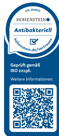
Beispiel: Zertifikat für Eurodekor

Unsere Produkte werden ohne Zusatz von antibakteriell wirkenden Additiven produziert und sind nach der wichtigsten, international anerkannten Testmethode (ISO 22196 = JIS Z 2801) zur Bewertung der antibakteriellen Aktivität geprüft. Zusätzlich sind unsere Produkte vom unabhängigen, externen Institut Hohenstein zertifiziert.