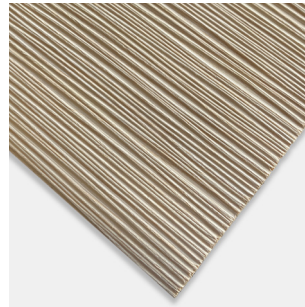
2252 Schilf Alpi Eiche hell