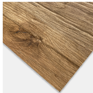
2512 Old Nature Altholz Eiche