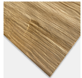
2578 Rough Old Wood Eiche rustikal