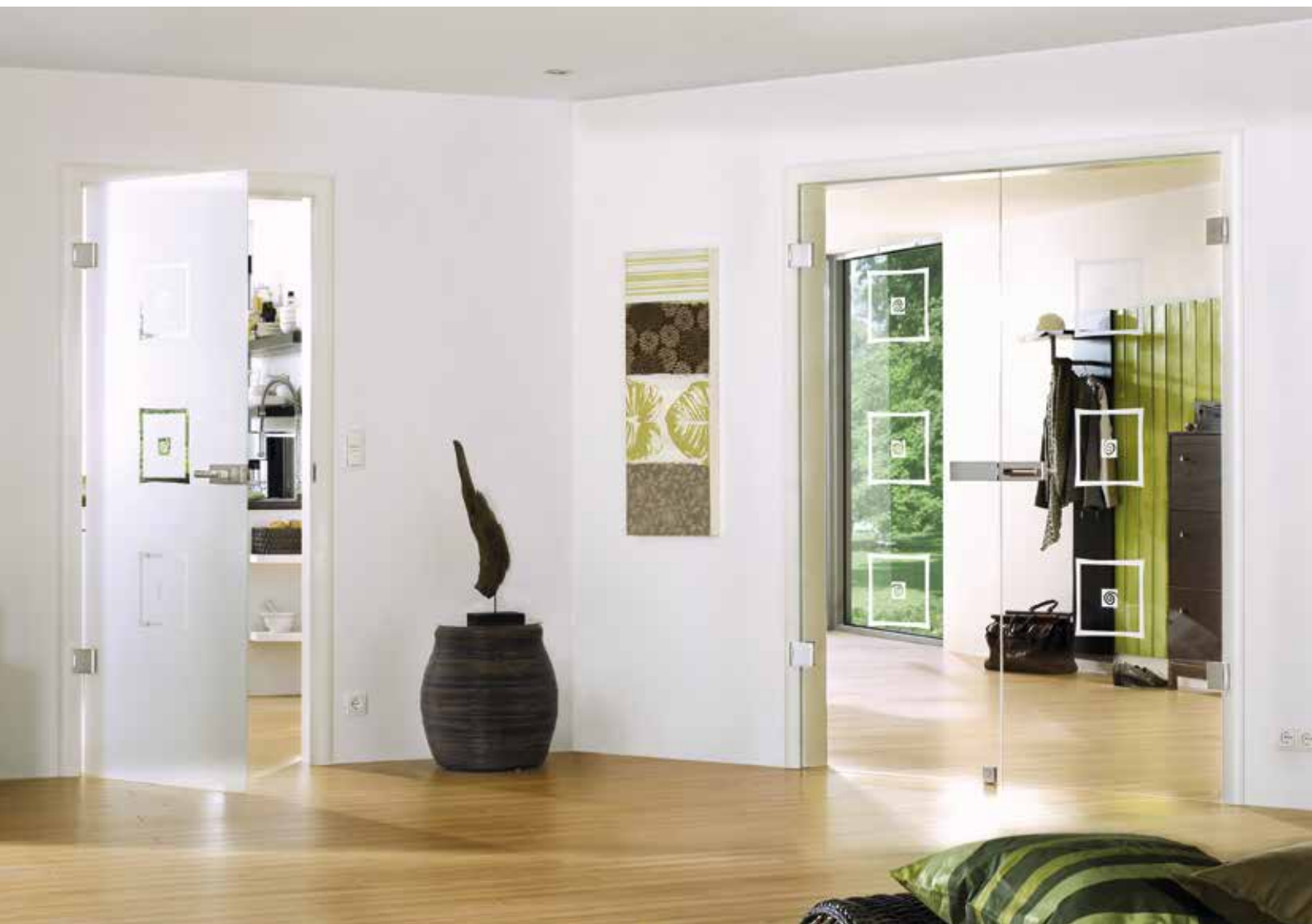
Modell links: Drehtür 1-flg. | Glasdesign: Alana, Motiv klar/Fläche matt, auch als Glasschiebetür und VSG-Tür | Beschlagset: Pure 2.0, ähnl. Edelstahl matt Modell rechts: Drehtür 2-flg. | Glasdesign: Alana, Motiv matt/Fläche klar, auch als Glasschiebetür und VSG-Tür | Beschlagset: Pure 2.0, ähnl. Edelstahl matt