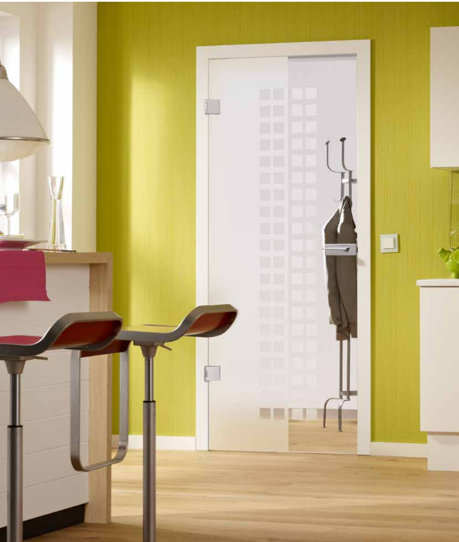
Drehtür 1-flg. | Glasdesign: Casandra, Motiv matt/Fläche klar | Beschlagset: Square 2.0, ähnl. Chrom Glanz