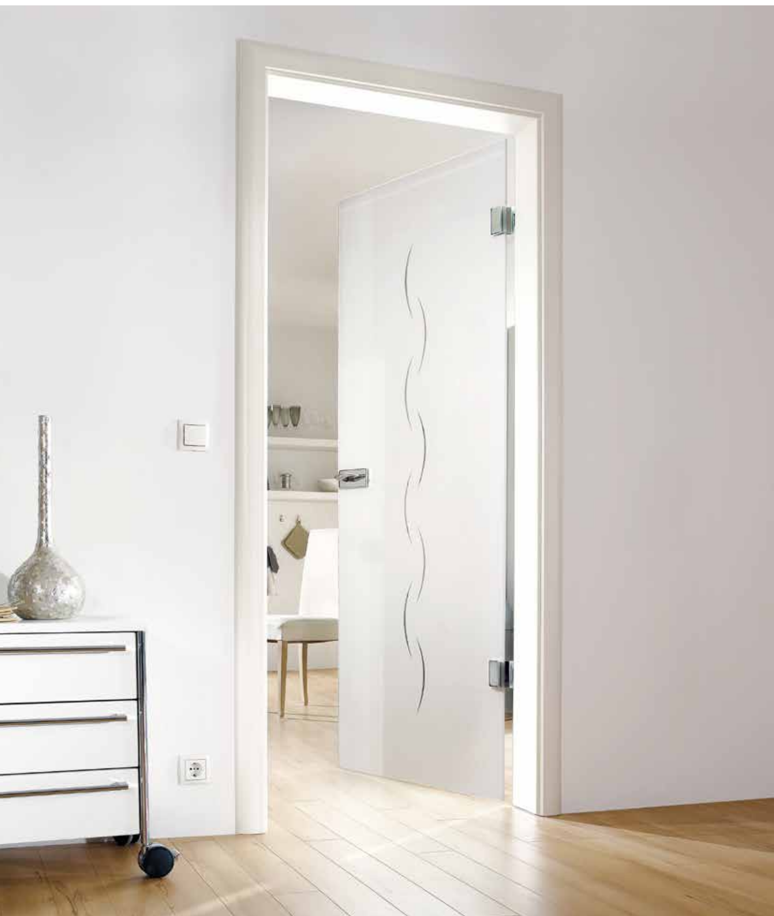
Drehtür 1-flg. | Glasdesign: Alinea, Motiv klar/Fläche matt, auch als Glasschiebetür und VSG-Tür | Beschlagset: Square 2.0, ähnl. Chrom Glanz