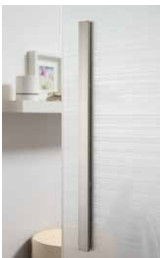
Glasdesign: Corteo | L&H Griffleiste beidseitig, 600 mm, ähnl. Edelstahl matt