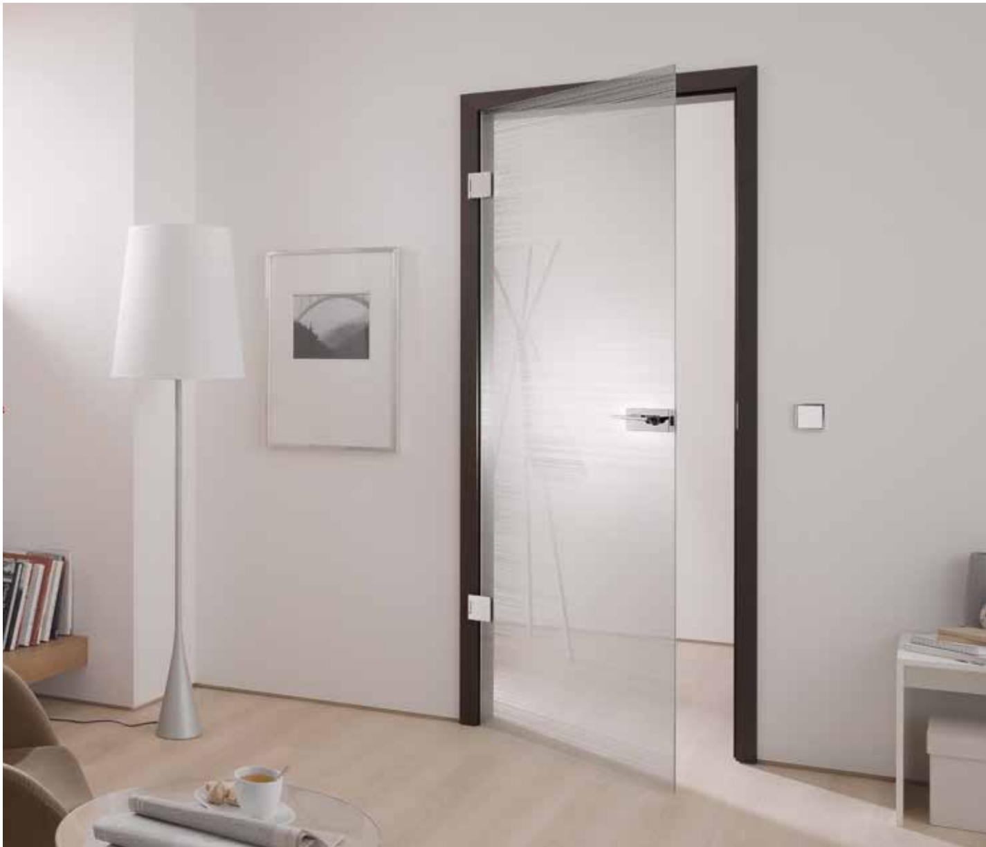
Drehtür 1-flg. | Glasdesign: Corteo | Beschlagset: Square 2.0, ähnl. Chrom Glanz