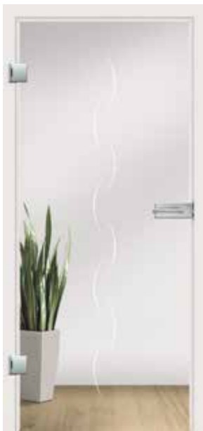
Alinea, Motiv matt / Fläche klar auch als Glasschiebetür und VSG-Tür