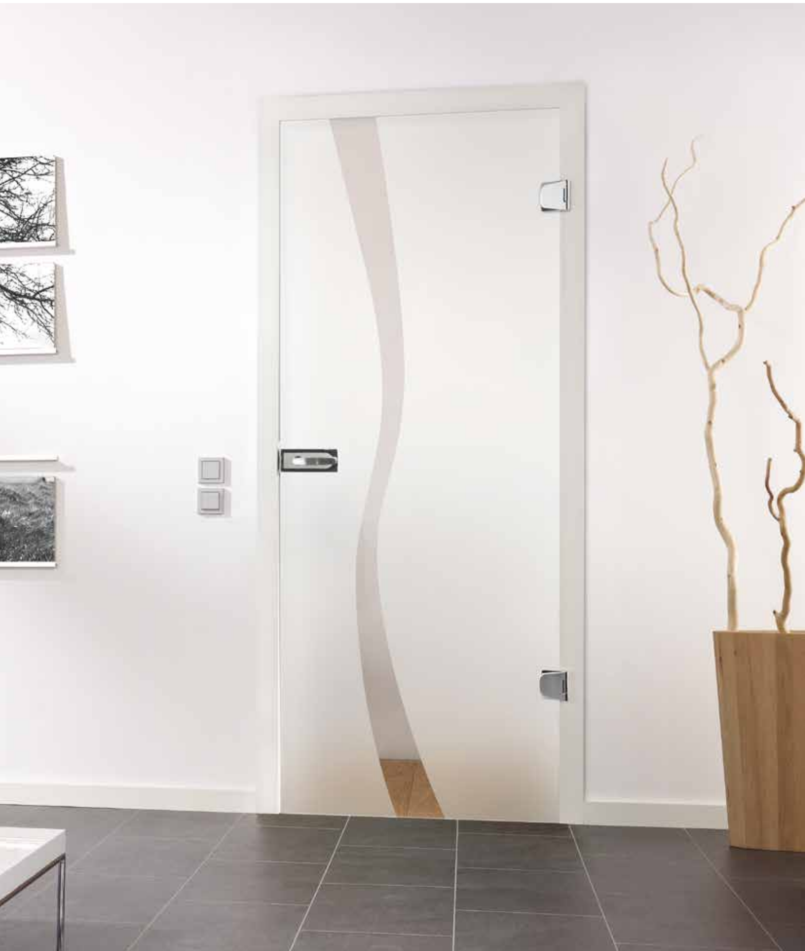
Drehtür 1-fig. | Glasdesign: Wave Typ 8, Motiv klar/Fläche matt, auch als Glasschiebetür und VSG-Tür | Beschlagset: Vista Due 2.0, ähnl. Chrom Glanz mit Inlay, weiß RAL 9010