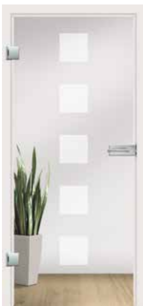
Flair, Motiv matt/Fläche klar