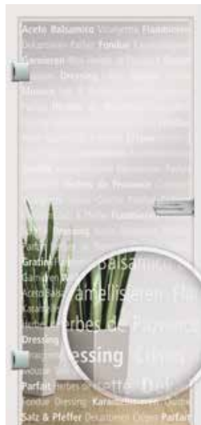
Culinaria, Schrift weiß / Fläche klar auch als Glasschiebetür und VSG-Tür