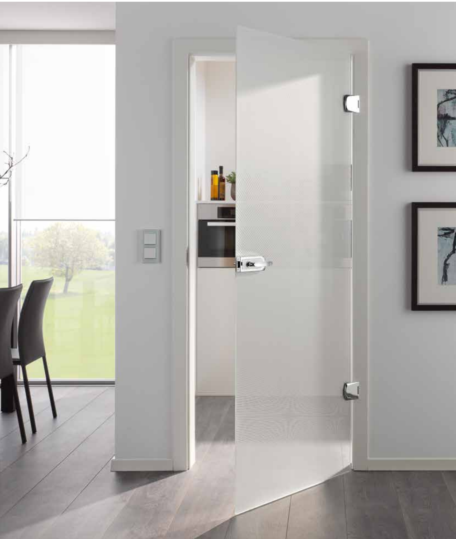
Drehtür 1-flg. | Glasdesign: Lucido | Beschlagset: Vista Due 2.0, ähnl. Chrom Glanz mit Inlay, weiß RAL 9010