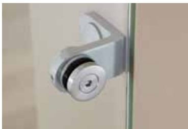
Punkthalter: Edition Basic Edelstahl matt