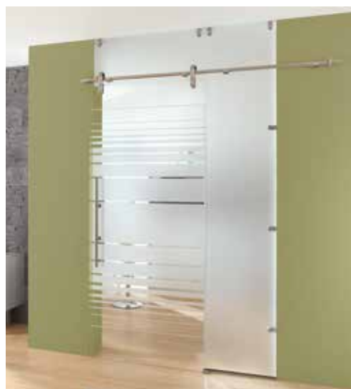
Glasschiebeanlage Typ 1 | Schiebesystem: Edition Basic, Edelstahl matt, Seitenteil und Oberlicht: Satinato Glasdesign: Struktura Typ 8, Motiv matt / Fläche klar Griffstange: L&H G 700 rund, Edelstahl matt

Alle Beschläge wie auch die Glasdesigns sind untereinander kombinierbar.