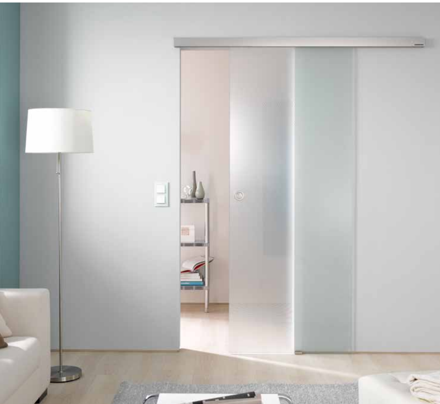
Schiebesystem 1-flg.: Tvin 2.0 Convex, ähnl. Edelstahl matt | Glasdesign: Lucido | Griffmuschel: L&H M 70, ähnl. Edelstahl matt