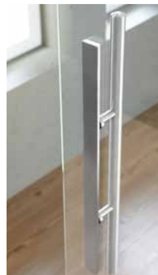
Rückansicht: L&H G 700 rund, Griffleiste einseitig, Edelstahl matt