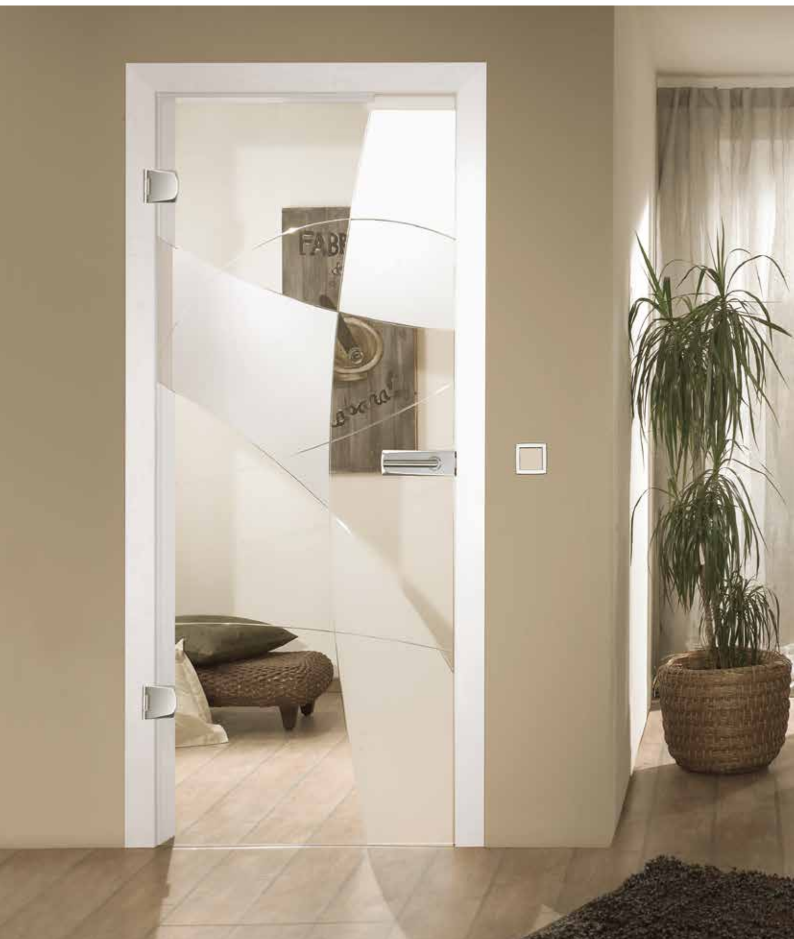
Drehtür 1-flg. | Glasdesign: Nubia, V-Rillenschliff poliert mit Satinierung auf Float hell, auch als Glasschiebetür | Beschlagset: Bacio 2.0, Chrom satiniert