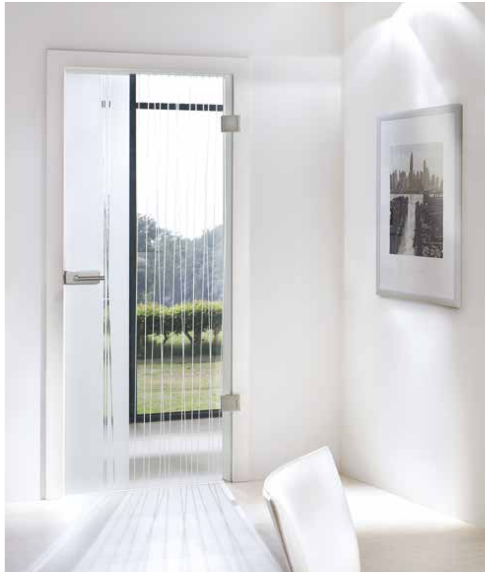
Drehtür 1-flg. | Glasdesign: Stream Typ 1, Motiv matt/Fläche klar, auch als Glasschiebetür und VSG-Tür Beschlagset: Square 2.0, ähnl. Edelstahl matt