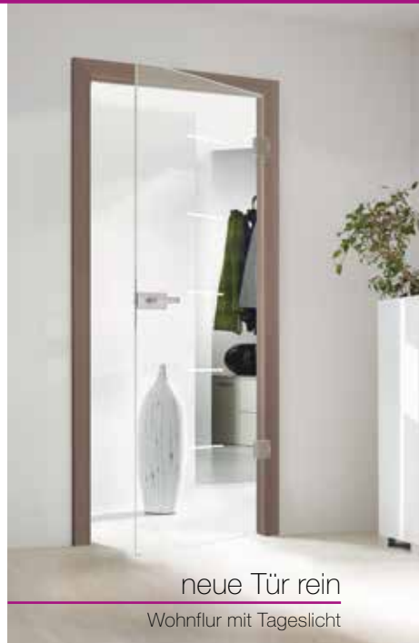
neue Tür rein Wohnflur mit Tageslicht