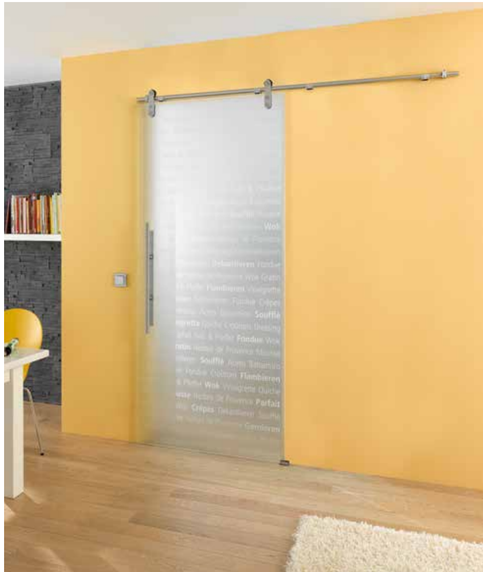
Schiebesystem 1-flg.: Edition Basic, Edelstahl matt | Glasdesign: Culinaria, Schrift weiß/Fläche matt Griffstange: L&H G 700 rund, Griffleiste einseitig, Edelstahl matt