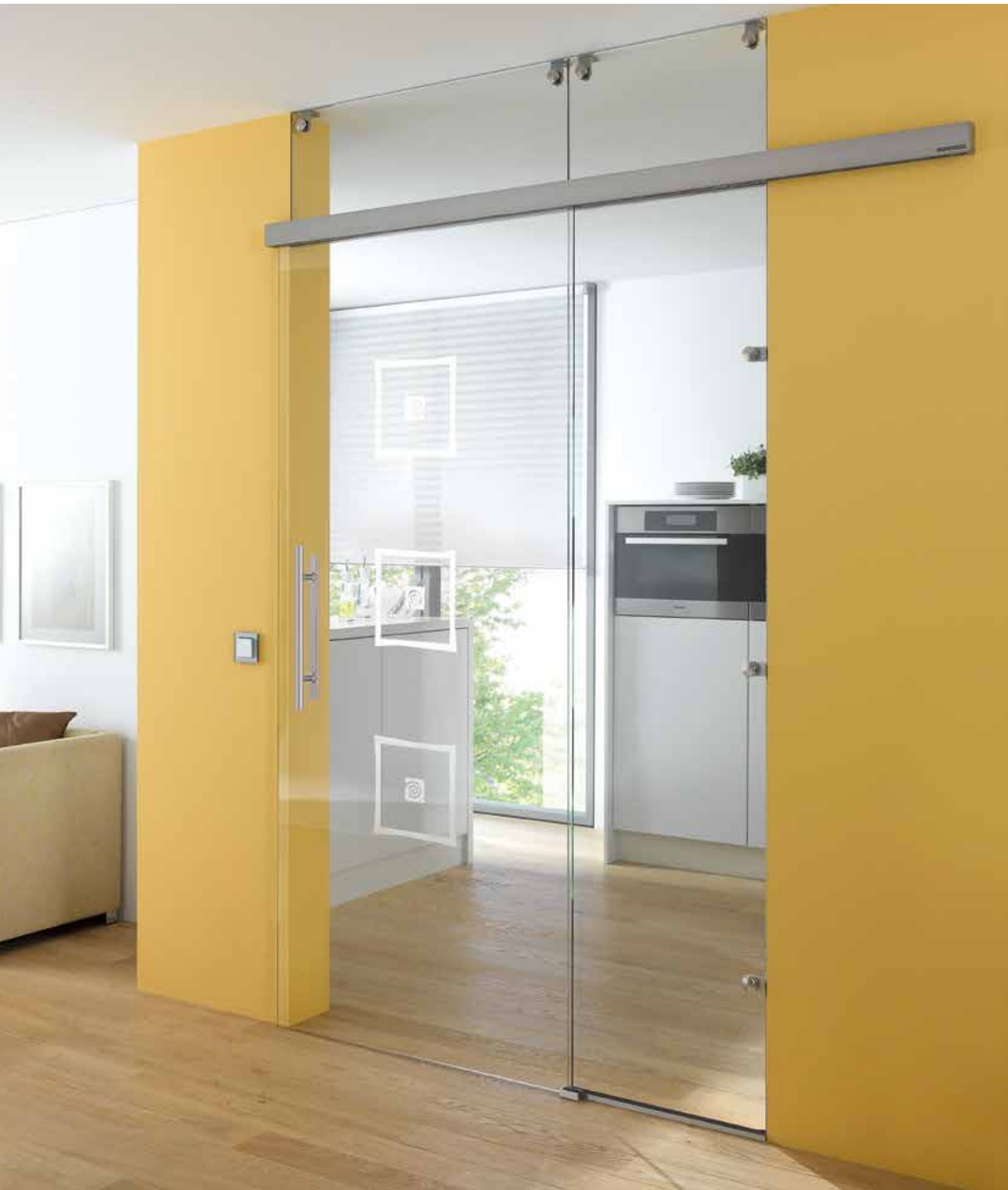
Glasschiebeanlage Typ 1 | Schiebesystem: Tvin 2.0/120, ähnl. Edelstahl matt, Seitenteil und Oberlicht: Float hell | Glasdesign: Alana, Motiv matt/Fläche klar Griffstange: L&H G 420 rund, Griffleiste einseitig, Edelstahl matt