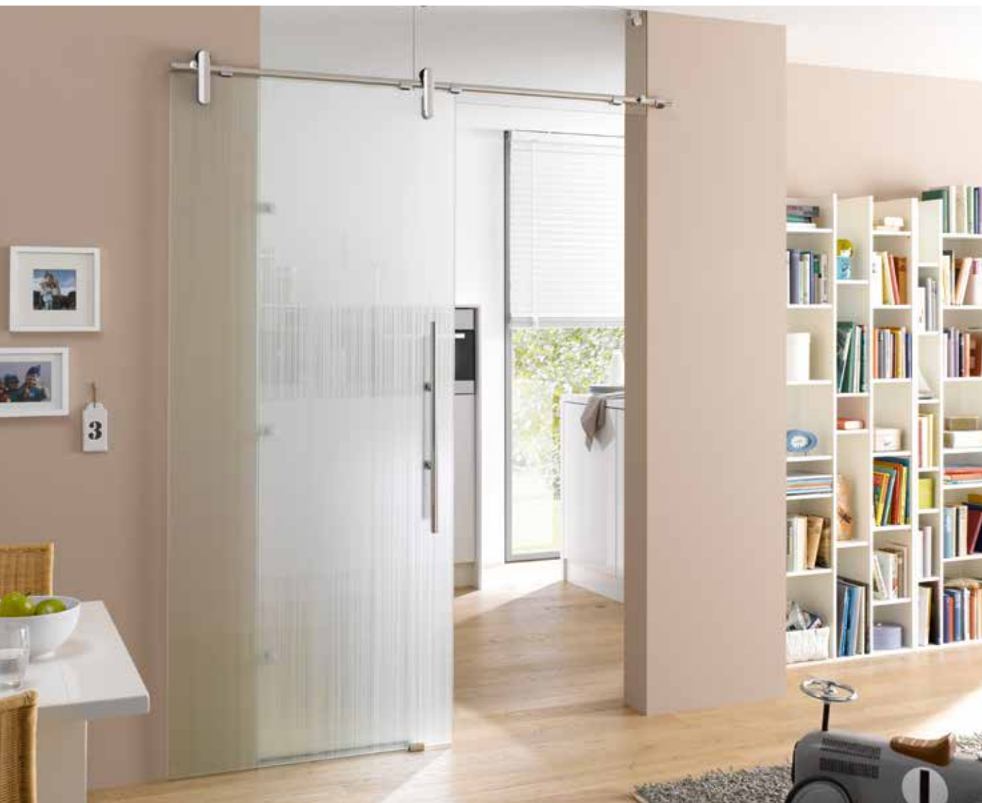
Glasschiebeanlage Typ 1 | Schiebesystem: Edition Style, Edelstahl Chrom Glanz poliert, Seitenteil und Oberlicht: Float hell | Glasdesign: Lista Due, Motiv beidseitig satiniert, 3D-Optik | Griffstange: L&H G 700 rund, Griffleiste einseitig, Edelstahl Chrom Glanz poliert