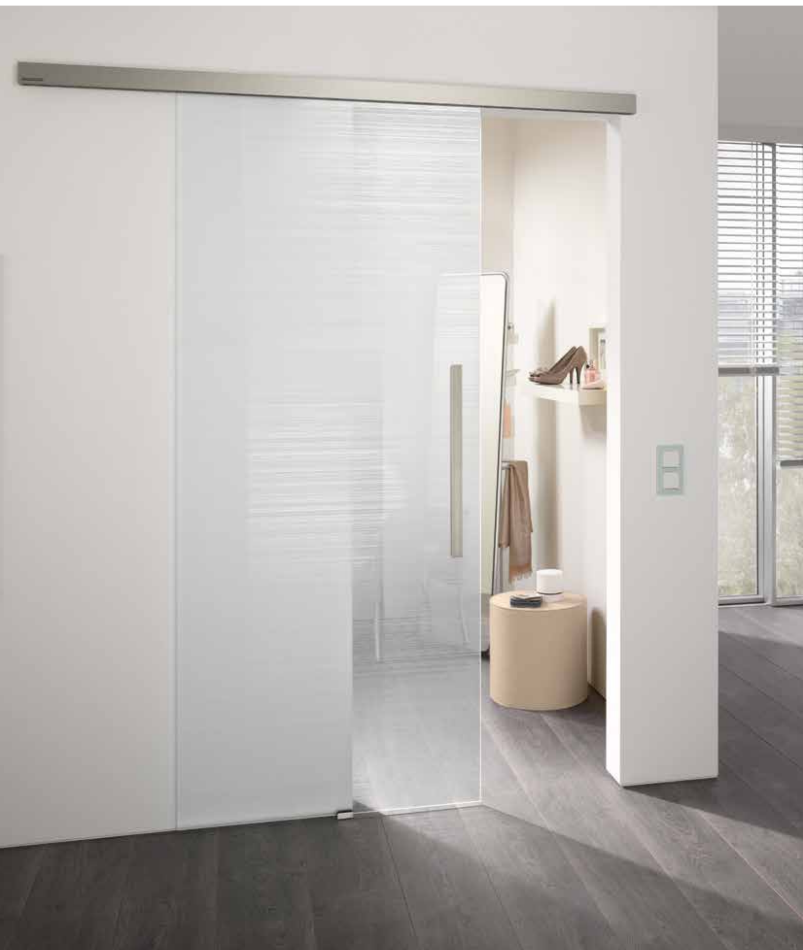
Schiebesystem 1-flg.: Tvin 2.0, ähnl. Edelstahl matt | Glasdesign: Corteo | L&H Griffleiste beidseitig, 600 mm, ähnl. Edelstahl matt