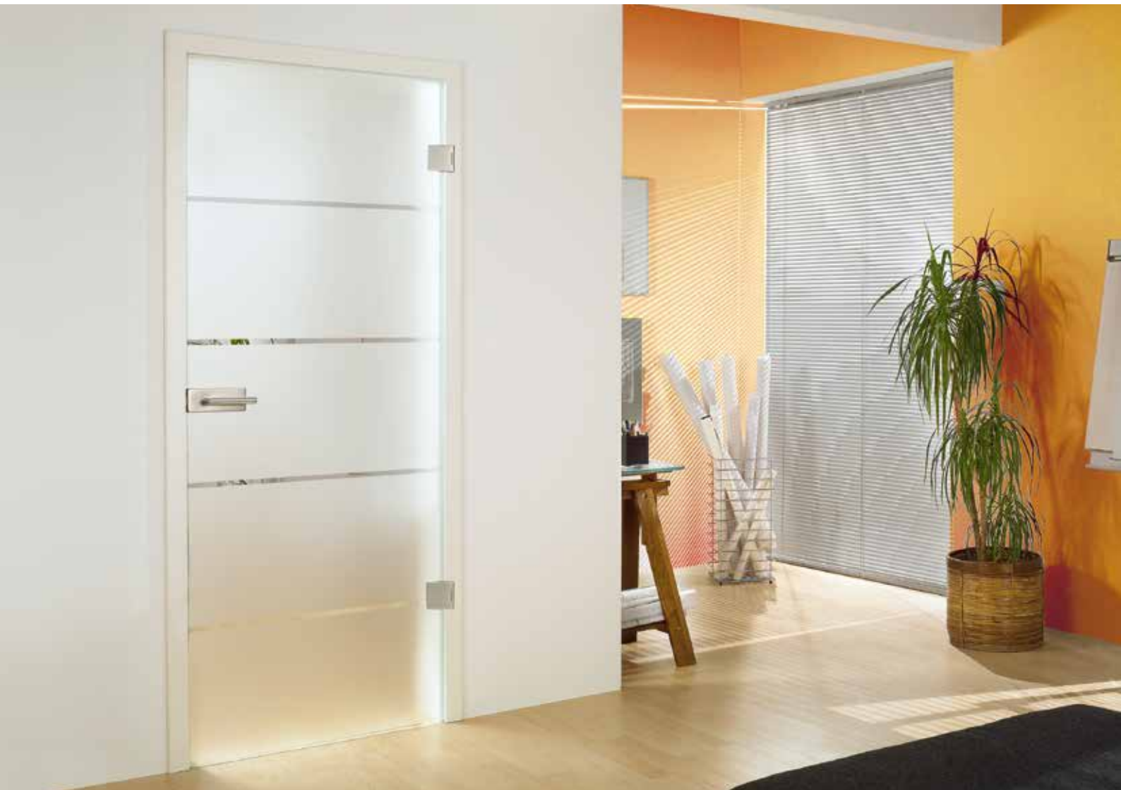
Drehtür 1-fig. | Glasdesign: Atos, Streifen klar / Fläche matt, auch als Glasschiebetür und VSG-Tür | Beschlagset: Square 2.0, ähnl. Edelstahl matt