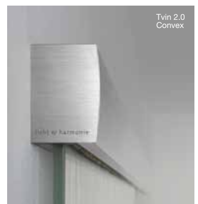
Tvin 2.0 Convex