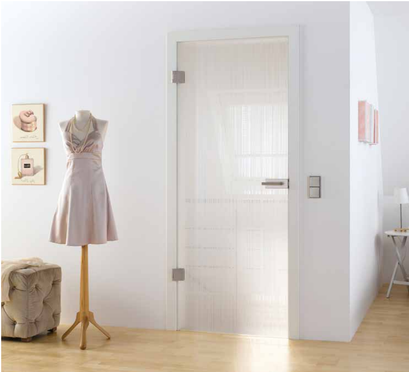
Drehtür 1-fig. | Glasdesign: Lista Due, Motiv beidseitig satiniert, 3D-Optik | Beschlagset: Square 2.0, ähnl. Edelstahl matt