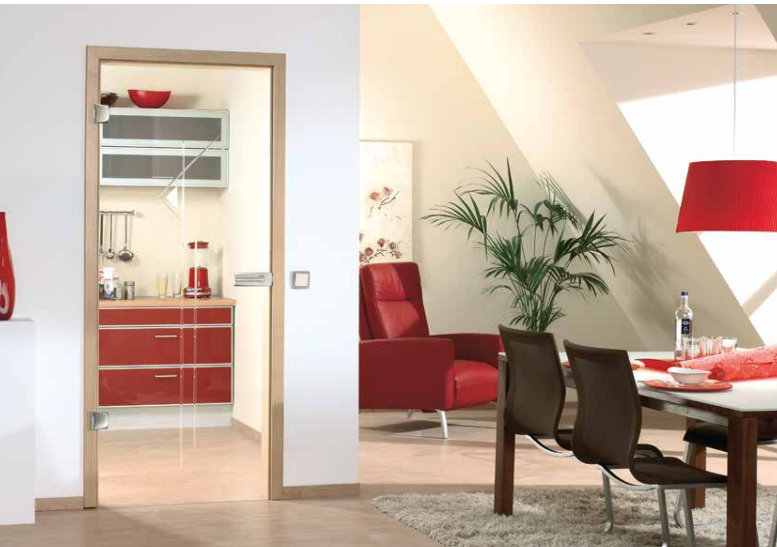
Drehtür 1-fig. | Glasdesign: Palatino, V-Rillenschliff poliert mit Satinierung auf Float hell | Beschlagset: Bacio 2.0, ähnl. Edelstahl matt