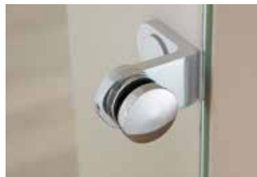
Punkthalter: Edition Style Edelstahl Chrom Glanz poliert