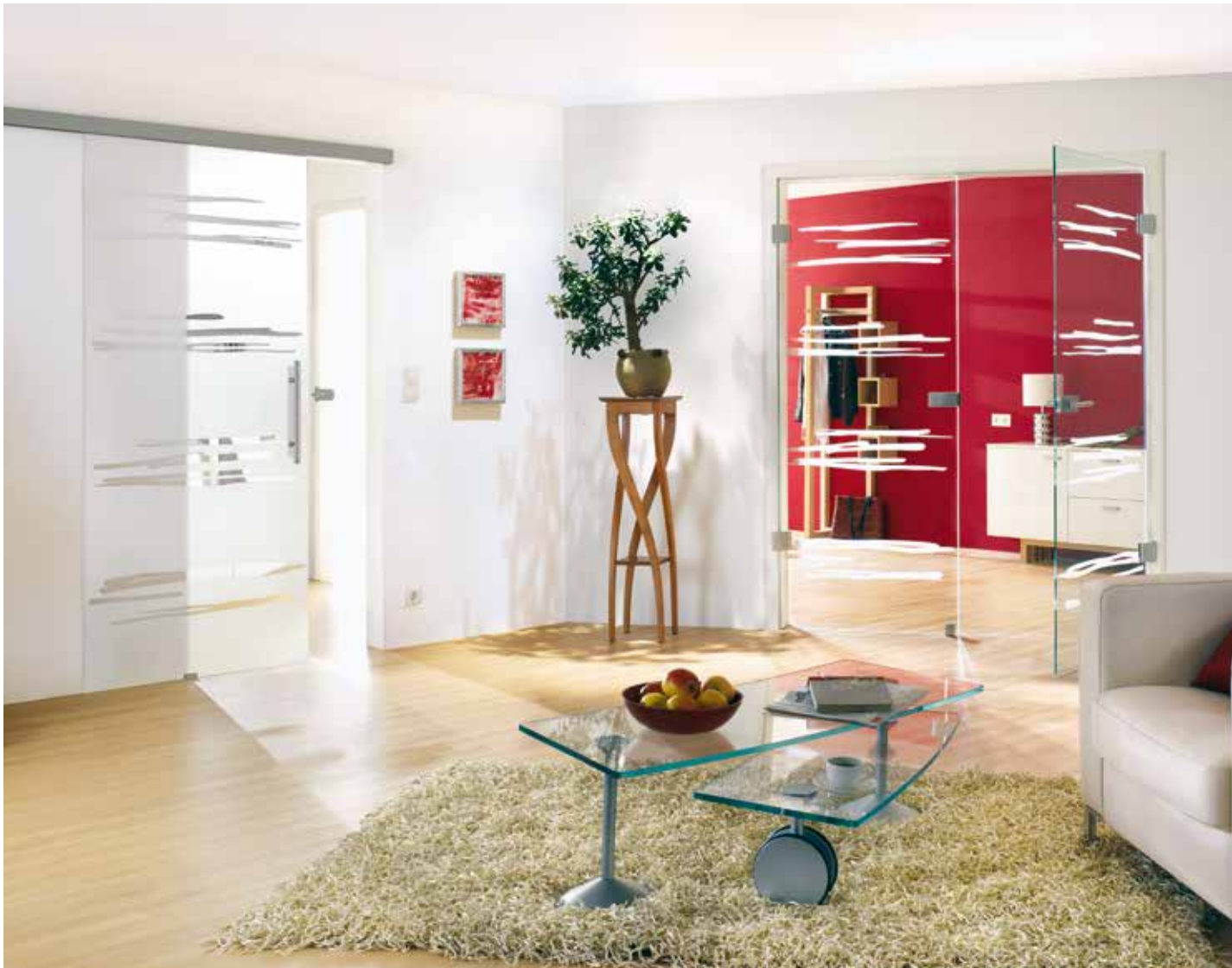
Modell links: Schiebesystem 1-flg.: Tvin 2.0, ähnl. Edelstahl matt | Glasdesign: Gemini, Motiv klar/Fläche matt | Griffstange: L&H G 420 rund, Griffleiste einseitig, Edelstahl matt Modell rechts: Drehtür 2-flg. | Glasdesign: Gemini, Motiv matt/Fläche klar, auch als Glasschiebetür und VSG-Tür | Beschlagset: Square 2.0, ähnl. Edelstahl matt