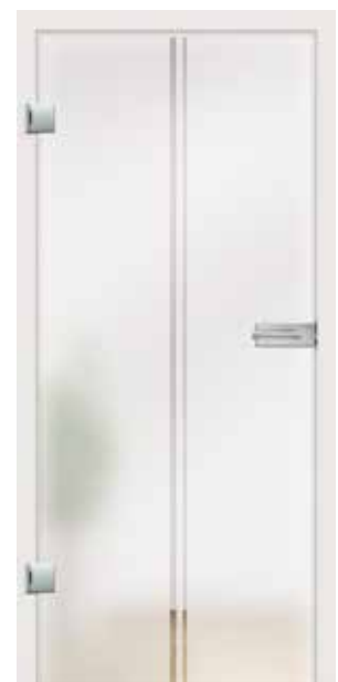
Piano, Motiv klar/Fläche matt