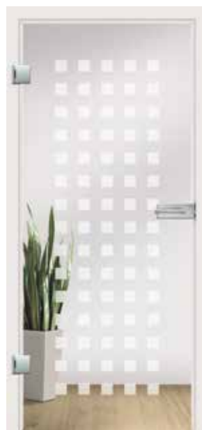
Carre, Motiv matt/Fläche klar