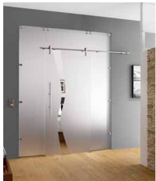
Glasschiebeanlage Typ 2 | Schiebeseystem: Edition Style, Edelstahl Chrom Glanz poliert, Seitenteil u. Oberlicht: Satinato | Glasdesign: Wave Typ 8, Motiv klar/Fläche matt | Griffstange: L&H G 700 rund, Edelstahl Chrom Glanz poliert