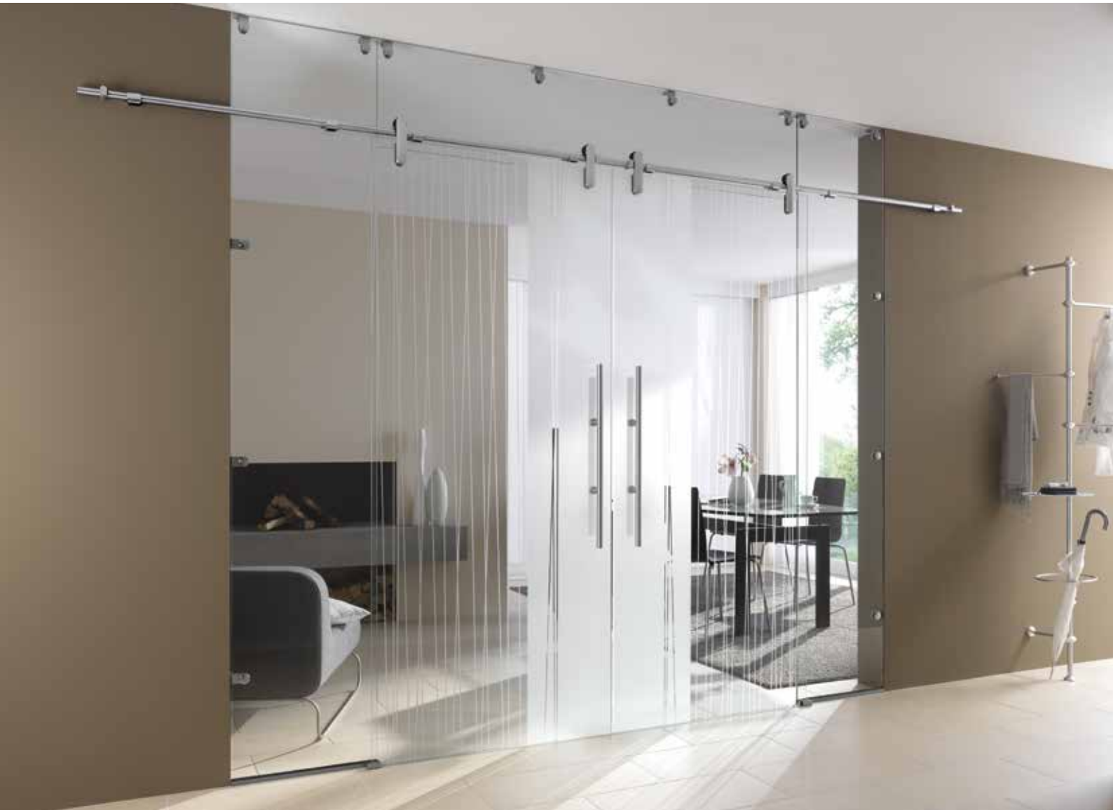
Glasschiebeanlage Typ 3 | Schiebesystem: Edition Style, Edelstahl Chrom Glanz poliert, Seitenteil und Oberlicht: Float hell | Glasdesign: Stream Typ 1, Motiv matt/Fläche klar Griffstangen: L&H G 700 rund, Griffleiste einseitig, Edelstahl Chrom Glanz poliert