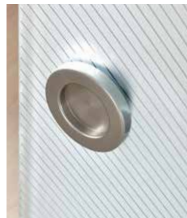
Glasdesign: Lucido | Griffmuschel: L&H M 70, ähnl. Edelstahl matt