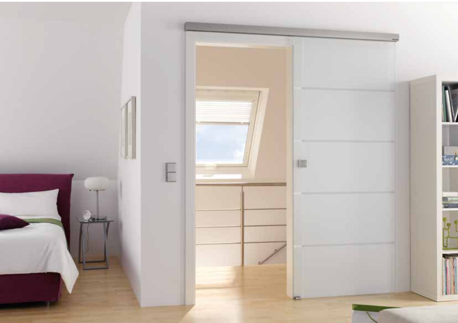
Schiebesystem 1-flg.: Tvin 2.0 Convex, ähnl. Edelstahl matt, Wand-Montage vor Zarge | Glasdesign: Atos, Streifen klar/Fläche matt | Griffmuschel: L&H M 60, ähnl. Edelstahl matt