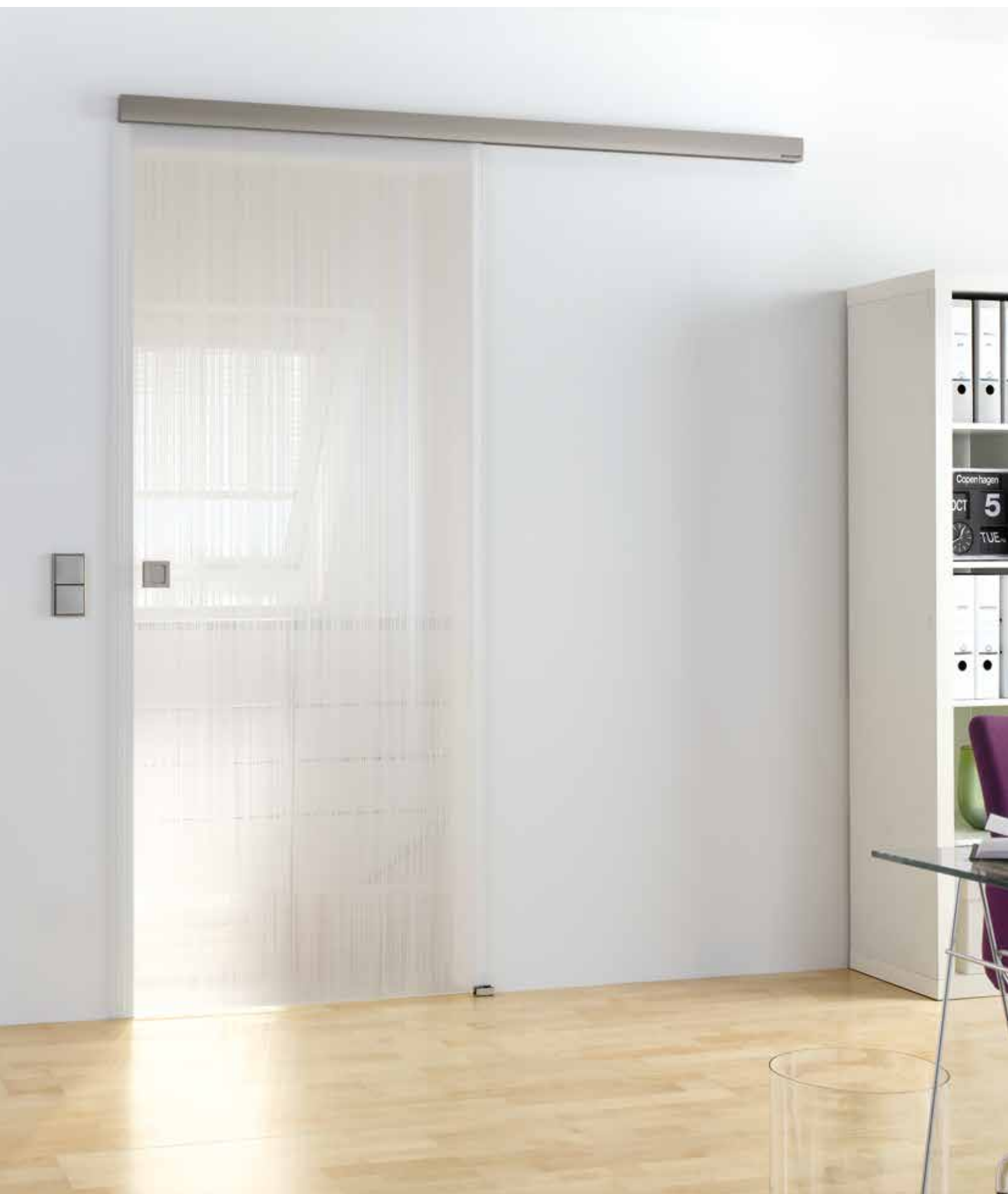
Schiebesystem 1-flg.: Tvin 2.0 Convex, ähnl. Edelstahl matt | Glasdesign: Lista Due, Motiv beidseitig satiniert, 3D-Optik | Griffmuschel: L&H M 60, ähnl. Edelstahl matt