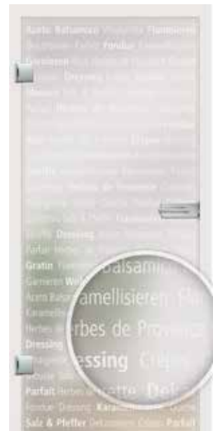
Culinaria, Schrift weiß / Fläche matt auch als Glasschiebetür und VSG-Tür