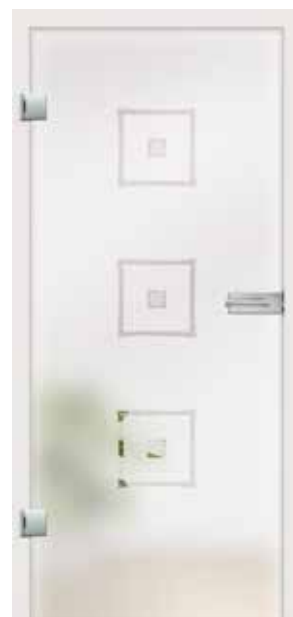
Alana, Motiv klar/Fläche matt auch als Glasschiebetür und VSG-Tür