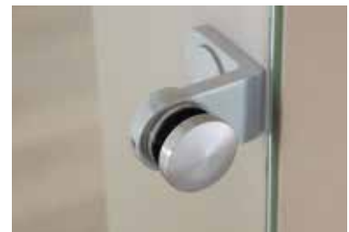
Punkthalter: Edition Style und Tvin 2.0/120 Edelstahl matt