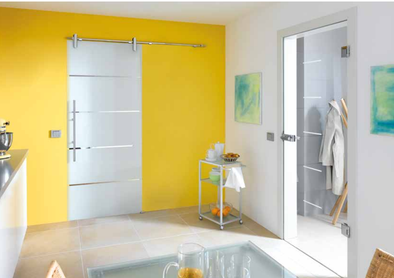
Modell links: Schiebesystem 1-fig.: Edition Style, Edelstahl Chrom Glanz poliert | Glasdesign: Atos, Streifen klar/Fläche matt | Griffstange: L&H G 700 rund, Edelstahl Chrom Glanz poliert Modell rechts: Drehtür 1-fig. | Glasdesign: Modus, Motiv matt/Fläche klar, auch als Glasschiebetür und VSG-Tür | Beschlagset: Pure 2.0, ähnl. Chrom Glanz