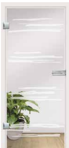
Gemini, Motiv matt / Fläche klar auch als Glasschiebetür und VSG-Tür