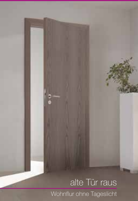
alte Tür raus Wohnflur ohne Tageslicht