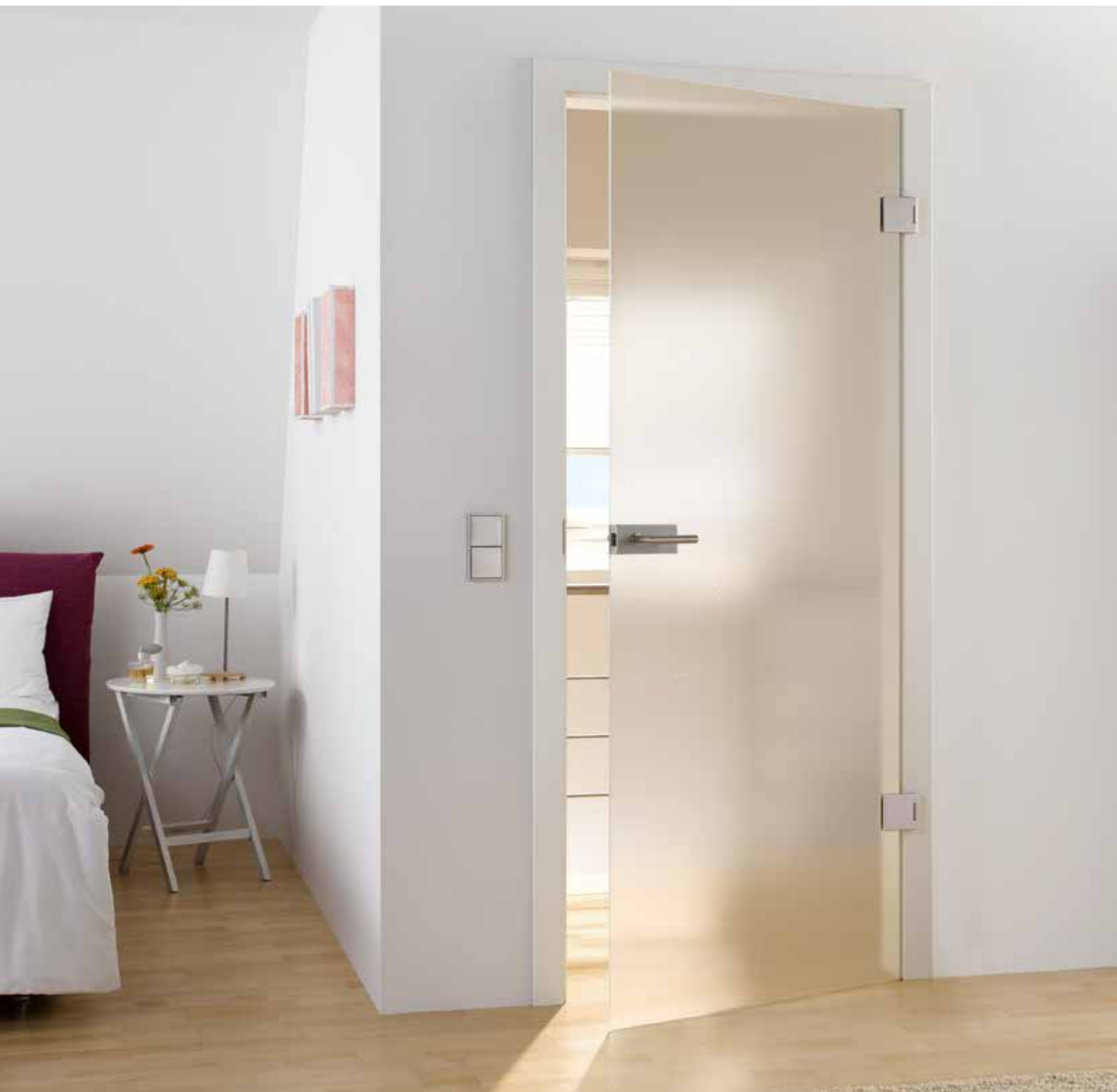
Drehtür 1-flg. | Glasdesign: Modena, auch als Glasschiebetür | Beschlagset: Square 2.0, ähnl. Edelstahl matt