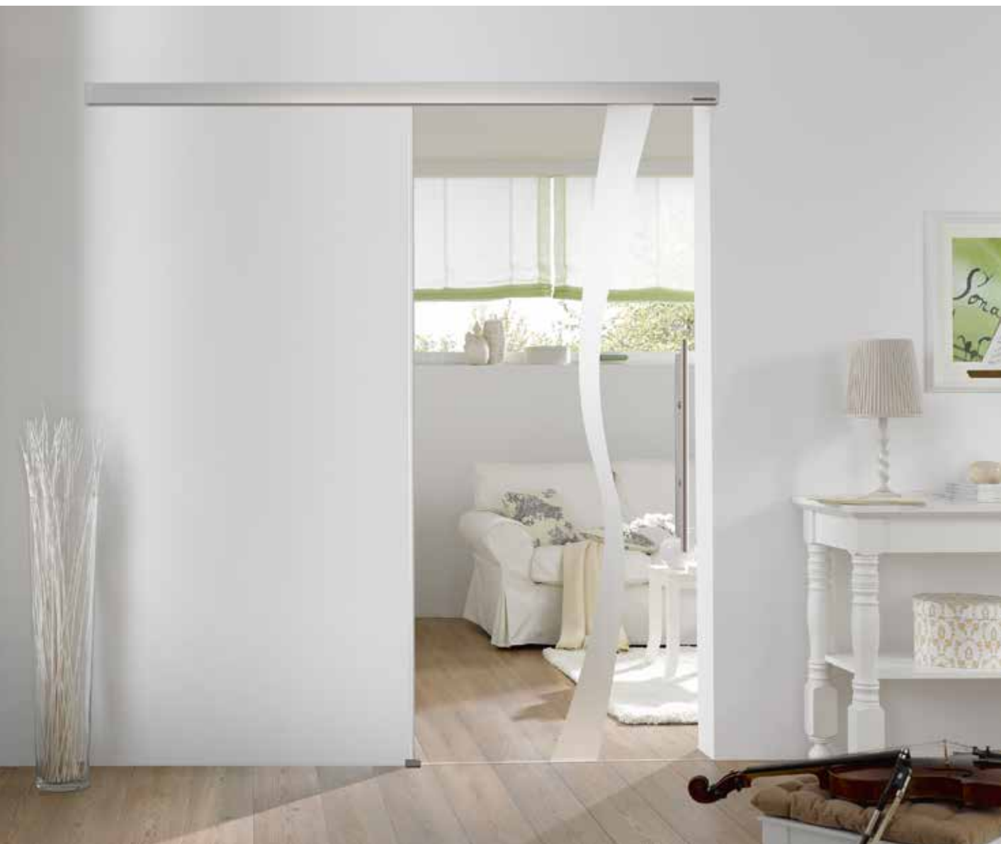
Schiebesystem 1-flg.: Tvin 2.0, ähnl. Edelstahl matt | Glasdesign: Wave Typ 8, Motiv matt/Fläche klar | Griffstange: L&H G 700 rund, Griffleiste einseitig, Edelstahl matt