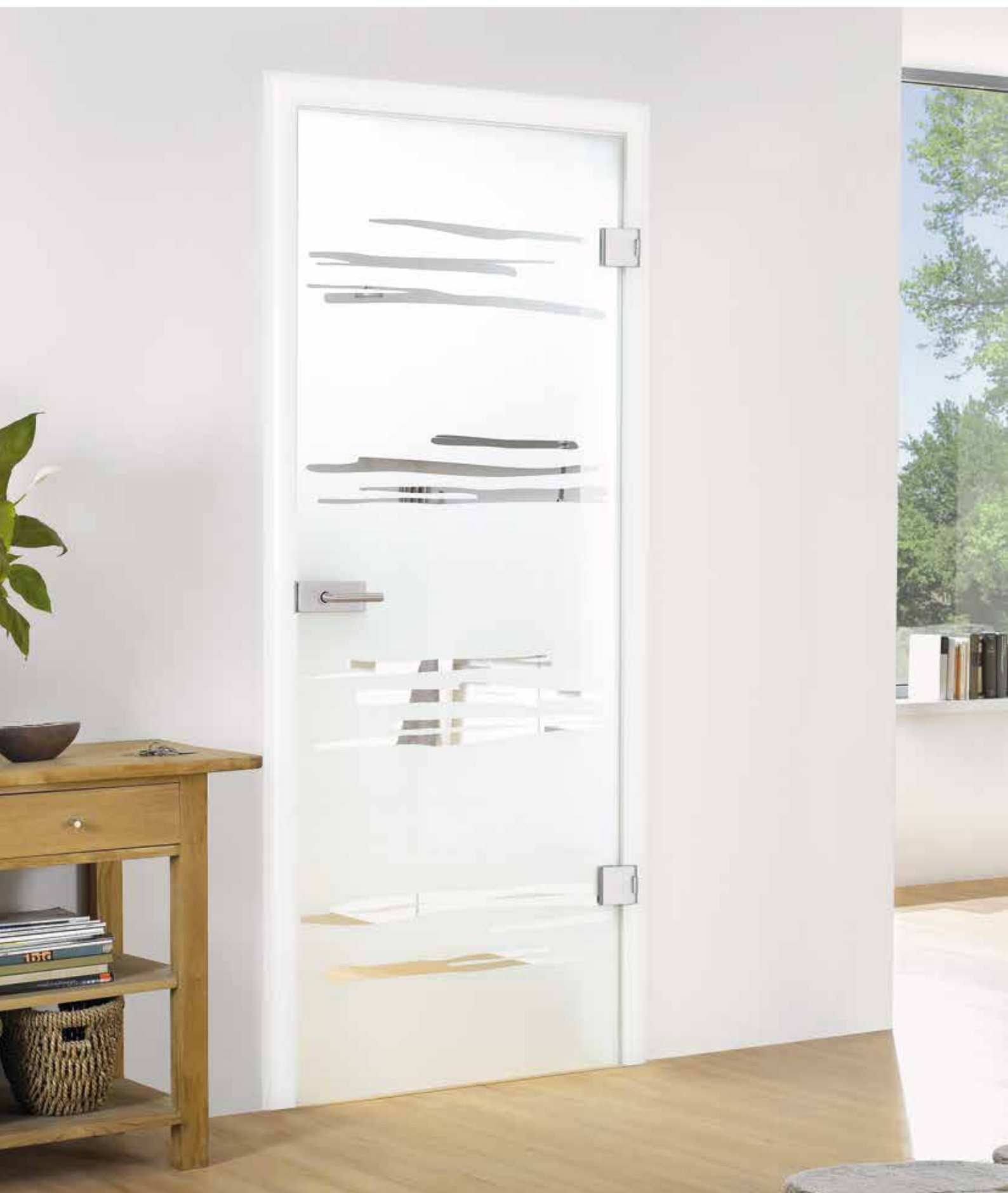
Drehtür 1-flg. | Glasdesign: Gemini, Motiv klar/Fläche matt, auch als Glasschiebetür und VSG-Tür | Beschlagset: Pure 2.0, Chrom satiniert